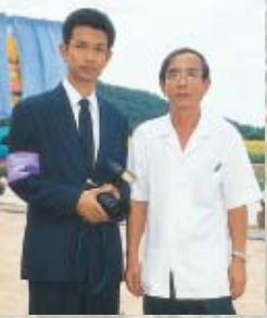
ผมและ "โต้ง" ถ่ายภาพร่วมกันก่อนพิธี เปิดงานอย่างเป็นทางการจะเริ่ม