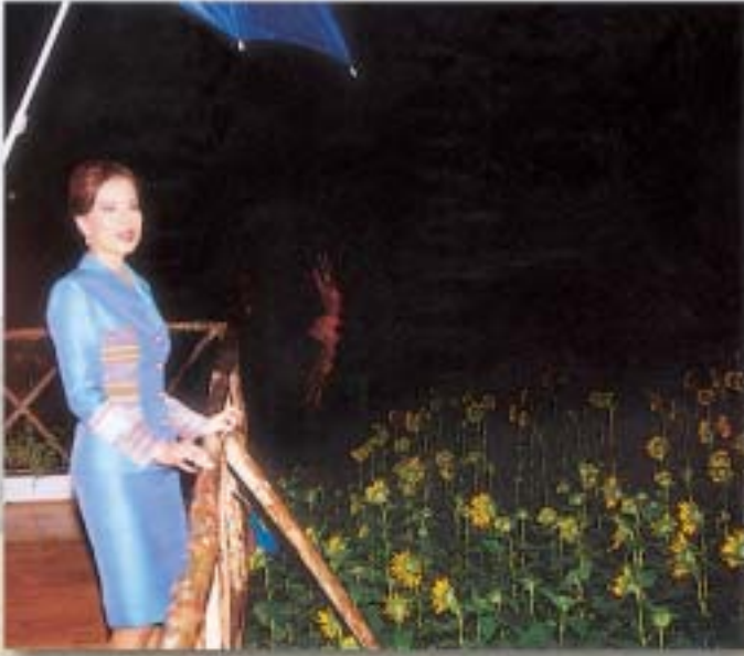
ทรงทอดพระเนตรทุ่งทานตะวัน ณ จุดชมวิวกว๊วคู

เทศกาลทุ่งทานตะวันบานสะพรั่งทั่วทั้งจังหวัดสระบุรีจะมี สลับกันไปตามอำเภอต่างๆ จนกระทั่งเดือนเมษายน หากใครมีเวลาก็ ควรหาโอกาสไปชมความสวยงามของทุ่งทานตะวัน รวมทั้งเลือกซื้อ ผลิตภัณฑ์ต่างๆ จากดอกทานตะวันมากมายหลายชนิด ล้วนแต่เป็น ของดีมีประโยชน์ทั้งสิ้น โดยเฉพาะน้ำทานตะวันซึ่งคิดและผลิตเป็น แห่งแรกของประเทศไทยที่อำเภอวังม่วง จังหวัดสระบุรี ซึ่งผู้ที่จะไปชม ทุ่งทานตะวันควรหาโอกาสไปในตอนเช้าจะดีที่สุด เพราะเป็นช่วงที่ ดอกทานตะวันบานสะพรั่งชูช่อเข้าหาดวงอาทิตย์เป็นภาพที่สวยงามยิ่ง