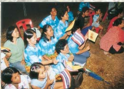
ส่วนหนึ่งของประชาชนที่มาเฝ้ารอรับเสด็จฯ หลายคนใส่เสื้อทานตะวันสีส้มสวยงาม