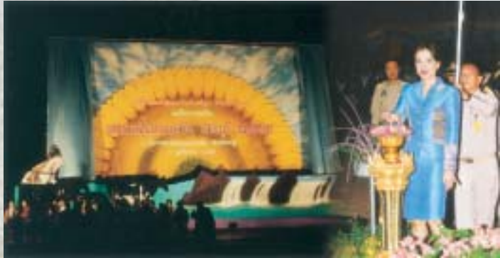
ทรงกตปุมแพครคลุมป้ายเปิดงานทุ่งทานตะวันบานสะพรั่งทั่วทั้งจังหวัดสระบุรี อย่างเป็นทางการ ทานตะวันดอกใหญ่ดอกนี้จะบานไปจนถึงเดือนเมษายน 2546 เป็นเวลา 6 เดือน

วิจิต วงศ์พานิช.....เรื่อง