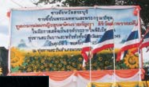
ชาวจังหวัดสระบุรีชื่นชมยินดีต่อการ เสด็จของทูลกระหม่อมหญิงอุบลรัตน ราชกัญญา สิริวัฒนาพรรณวดี ยิ่งนัก

ผมต้องขอขอบคุณสำนักงานประชาสัมพันธ์จังหวัดสระบุรี น.ส.พ. ประชาชน และน.ส.พ. เสียงมหาชน ในด้านข้อมูลข่าวสารเกี่ยว กับงานทุ่งทานตะวันบาน มาโดยตลอดและเป็นผลให้งานของจุลสาร รพ.สระบุรีสำเร็จลุล่วงลงได้ด้วยดี