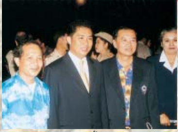
นายสนทยา คุณปลื้ม รมต.กระทรวง การท่องเที่ยวและกีฬาเป็นขวัญใจของคน ทั่วไปที่เข้ามาขอถ่ายรูปด้วย ไม่ว่าจะหญิง หรือชาย