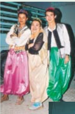
ภาคค่ำเป็นการแสดงบนเวที ตื่นเต้น เร้าใจ รวดเร็ว กระชับ ถูกใจผู้ชม

เปิดท้ายขายของก็ขายดิบขายดี แม่ค้าหน้าหวานขายทั้งขนมหวาน น้ำปลาหวาน น้ำหวาน อะไรจะหวานขนาดนั้น ? ซ้ำว่า ลูกขึ้นทอดบาบิควิ ฯลฯ แถมด้วยเทคนิคลีลาการขายที่แม่ค้าตัวจริงทำไม่เคยได้