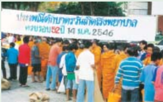
ตั้งแต่เช้าตรู่ทำบุญสุนทานกันถ้วนหน้า

14 ม.ค. 46 วันเกิดโรงพยาบาลของเรา ในโอกาสฉลองครบอายุ 52 ปี มีภาพความหลังประทับใจมากมายเกิดขึ้นที่นี่