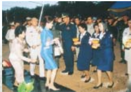
ทูลกระหม่อมหญิงอุบลรัตนราชกัญญาฯ เสด็จมาถึงงานเมื่อเวลา 17.17 น.

เมื่อมีข่าวว่าในการเปิดงานเทศกาลทุ่งทานตะวันบานสะพรั่งทั่วทั้งจังหวัดสระบุรีในวันศุกร์ที่ 1 พฤศจิกายน ประจำปี พ.ศ. 2545 ทางจังหวัดสระบุรีได้ทูลเชิญทูลกระหม่อมหญิงอุบลรัตนราชกัญญา สิริวัฒนาพรรณวดี เสด็จฯ มาเป็นองค์ประธานในพิธีเปิดงานประจำปีนี้ ผมจึงได้ติดต่อไปทางสำนักงานประชาสัมพันธ์จังหวัด