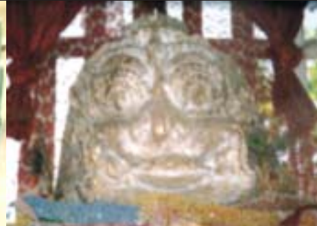
เกียรติมุขเป็นรูปหน้าขบหรือยักษ์คล้ายราหู มีแต่หัว ไม่มีแขน ไม่มีขา ประดิษฐานอยู่ตรงหน้าบันหรือส่วน मुखของเทวาลัยสมัยขอมโบราณอยู่ที่ศาลเจ้าพ่อน้อย อ.เสาไห้ จ.สระบุรี

เมื่อฉบับที่แล้วผมได้เล่าถึงภาพรวมโดยทั่วไปของหนังสือ “วัฒนธรรม พัฒนาการทางประวัติศาสตร์ เอกลักษณ์และภูมิปัญญาจังหวัดสระบุรี” โดยย่อไปแล้ว ซึ่งยังมีเรื่องที่น่าสนใจอีกหลายเรื่อง โดยเฉพาะความเป็นมาตั้งแต่ยุคแรกเริ่มสมัยก่อนประวัติศาสตร์เรื่อยมาจนถึงยุคของกรุงรัตนโกสินทร์ตอนต้น (ถึงสมัยรัชกาลที่ 5) ฉบับนี้ผมก็จะเขียนถึงบางเรื่องที่น่าสนใจที่จะนำมาถ่ายทอดต่อผู้ที่ไม่มีโอกาสได้เห็นหนังสือเล่มนี้