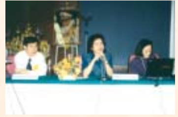
“ประชุมวิชาการสัญจร ครั้งที่ 5 / 2546” จัดโดยกลุ่มงานอายุรกรรม : 24 ก.ค. 46