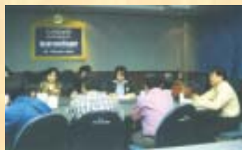
รพ.พระนครศรีอยุธยา...ดูงานศูนย์ประชาสัมพันธ์ : 26 ก.ย. 46