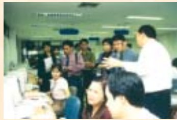
การประชุมเชิงปฏิบัติการโครงการพัฒนาศูนย์ Best Practice สถานบริการสาธารณสุข (สำหรับ รพ.สระบุรีดีเด่นในเรื่อง ระบบเทคโนโลยีสารสนเทศ) : 3 ก.ย. 46