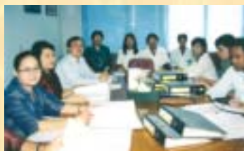
รพ.อินทรีบุรี...ดูงานการพัฒนาคุณภาพห้องปฏิบัติการ