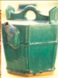
ปานน้ำชาโบราณสมัยทวารวดี ขุดค้นพบที่บ้านอู่ตะเภาเช่นกัน