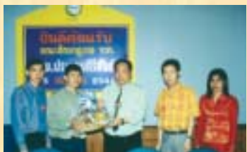
รพ.ประจวบคีรีขันธ์...ดูงานระบบ I T : 25 ก.ย. 46