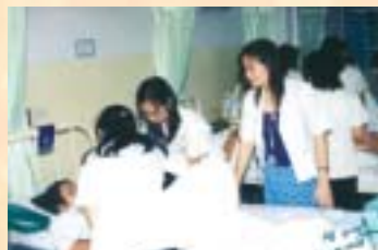
นิสิตกายภาพบำบัด มหาวิทยาลัยศรีนครินทรวิโรฒ...ดูงานกายภาพบำบัดในมารดาาระหว่างตั้งครรภ์และหลังคลอด : 8 ก.ค. 46