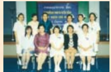
ประชุม “การพัฒนาคุณภาพพยาบาลวิชาชีพ” : 16 ก.ย. 46