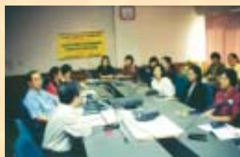
รพ.สวรรคตประชารักษ์...ดูงานการพัฒนา งานอนามัยแม่และเด็ก : 17 ก.ย. 46