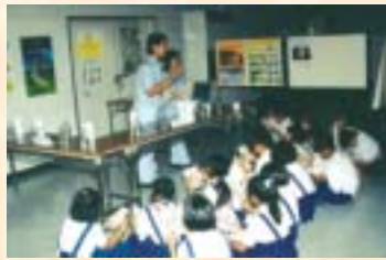
โครงการอบรมผู้นำนักเรียนส่งเสริมสุขภาพ ประจำปี 2546 จำนวน 5 รุ่น : ส.ค. 46