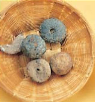
ลูกปัดและเบี้ยโบราณสมัยทวารวดี ขุดค้นพบที่บ้านอู่ตะเภา อำเภอหนองแซง จังหวัดสระบุรี