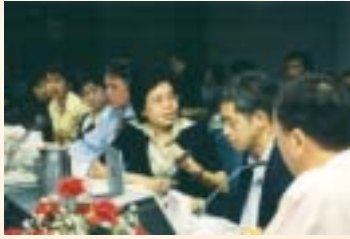
สถาบันพัฒนาและรับรองคุณภาพโรงพยาบาล (พรพ.) มาเยี่ยมสำรวจให้คำปรึกษาเข้ม ครั้งที่ 3 เพื่อเตรียมความพร้อมของ รพ.สระบุรีก่อนขอรับรอง HA ในเดือนธันวาคมนี้ : 20-23 ส.ค.46