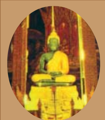
พระแก้วมรกตวัดพระศรีรัตนศาสดาราม กรุงเทพฯ เมื่อ 224 ปีมาแล้ว เคยมาประดิษฐานอยู่ที่วัดศรีรัตนาราม (วัดปากเปรี้ยว) เป็นเวลาไม่น้อยกว่า 1 เดือน

ในสมัยประวัติศาสตร์ของไทยนั้น เริ่มแรกก็เป็นยุคทวารวดีซึ่งในจังหวัดสระบุรีพบหลักฐานในยุคนี้หลายอย่างเช่น บ้านอู่ตะเภา (บ้านดงเมือง) อําเภอหนองแซง มีการขุดค้นพบสิ่งของเครื่องใช้ต่างๆ เช่น กำไลข้อมือ ลูกปัด