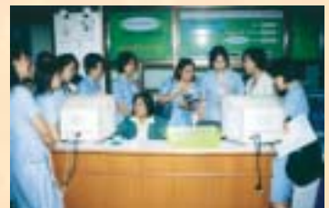
วิทยาลัยพยาบาลลำปาง...ดูงานระบบ I T : 25 ก.ค. 46