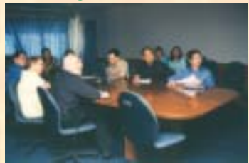
สถาบันวิทยาศาสตร์สุขภาพ มหาวิทยาลัยรามคำแหง...ดูงานการจัดระบบข้อมูลของโรงพยาบาล : 27 พ.ค. 46