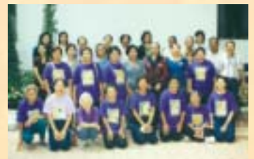
ชมรมผู้ป่วยเบาหวาน โรงพยาบาลเสนา จ.พระนครศรีอยุธยา...ดูงานการจัดกิจกรรมสำหรับผู้ป่วยเบาหวาน : 19 ก.ย. 46