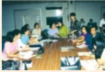
ประชุมจัดทำแผนกลยุทธ์ รพ.สระบุรี ประจำปี 2547 โดยคณะกรรมการบริหารและหัวหน้าหน่วยงานทุกหน่วย ถึงแม้จะเป็นช่วงวันหยุด 11 - 13 ส.ค. 46