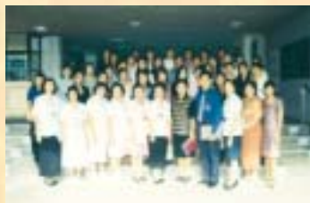
รพ. ศูนย์การแพทย์สมเด็จพระเทพฯ จ.นครนายก...ดูงาน 5 ส. : 11 ก.ย. 46