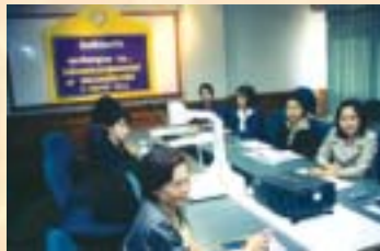
สำนักงานสาธารณสุข จังหวัดนครสวรรค์...ดูงานการจัดทำทะเบียนมะเร็ง : 11 มิ.ย. 46