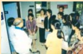
รพ.สรรพสิทธิประสงค์...ดูงานกลุ่มงาน หู คอ จมูก : 25 ส.ค. 46