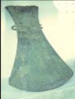
ขวานโบราณสมัยยุคก่อนประวัติศาสตร์ ภาพถ่ายนี้ถ่ายจากพิพิธภัณฑ์จังหวัดสระบุรี ที่ศูนย์ประวัติศาสตร์ จังหวัดพระนครศรีอยุธยา